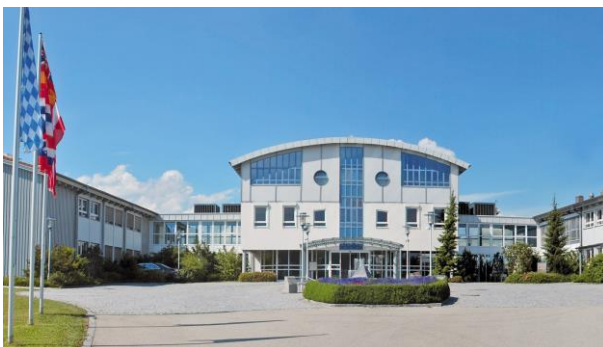
Bild1: Haas Firmenzentrale im niederbayerischen Falkenberg