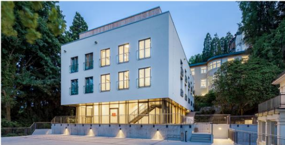
Bild 6: Beim Bau von Wohnbauprojekten vereint Haas die Kompetenzen aus den Bereichen Hausbau und Gewerbebau miteinander. Der Geschäftsbereich soll in den kommenden Jahren zu einer tragenden Säule des Unternehmens ausgebaut werden.