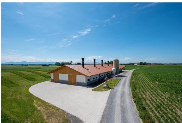
Bild 5: Seit über 45 Jahren werden bei Haas Gebäude für die Landwirtschaft gebaut. Heute steht der Landwirtschaftsbau für 15% des Umsatzes von Haas.

Bild 4: Der Bau von teil- und schlüsselfertigen Gewerbe- und Industrie-projekten in Holzfertig- und Hybridbauweise ist seit den 80er Jahren eine tragende Säule des Haas Geschäftsmodells.