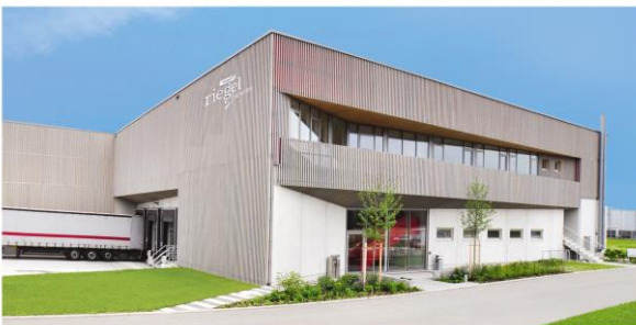
Bild 4: Der Bau von teil- und schlüsselfertigen Gewerbe- und Industrie-projekten in Holzfertig- und Hybridbauweise ist seit den 80er Jahren eine tragende Säule des Haas Geschäftsmodells.

Ein- und Zweifamilienhäuser stehen mit über 60% Anteil am Umsatz des Unternehmens für das Hauptgeschäft von Haas Fertigbau. Seit 1972 wurden bereits 30.000 Projekte realisiert.