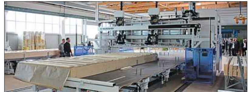
Bis zu 14 Meter lange Dach- und Deckenelemente können mit der neuen, teilautomatischen Fertigungslinie produziert werden.

gleich nun angesichts der konjunkturellen Entwicklungen wohl „eine Bergetappe“ bevorstehe. Die Wichtigkeit des Holzbaus in Zeiten des Klimawandels hob Dr. Denny Ohnesorge, Geschäftsführer des Deutschen Holz-